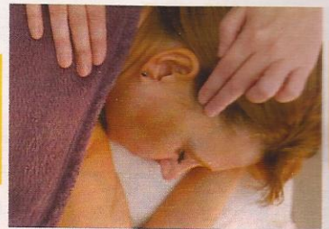
CABEZA. Esta zona representa la parte mental: ideas, iniciativa, intuición...