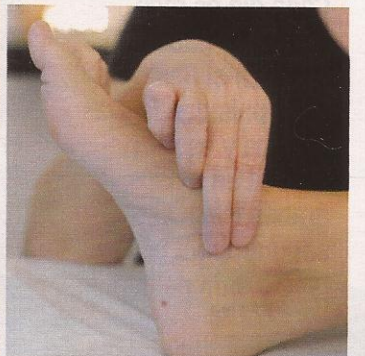
PIES. Son la parte física, la posición en el mundo, el equilibrio interior.